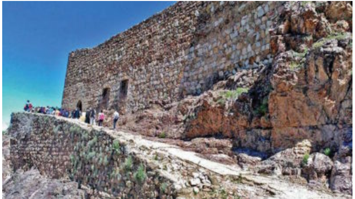
FUNDACIÓN CASTILLO LA ESTRELLA

Por la tarde, a las 17,30, habrá visita guiada al Castillo de Terrinches, recuperado por su Ayuntamiento como Centro de Interpretación de la Orden de Santiago, donde posteriormente a las 19 horas un recital de música